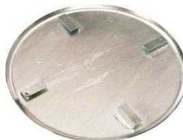
Piatto lisciatura Smoothing plate