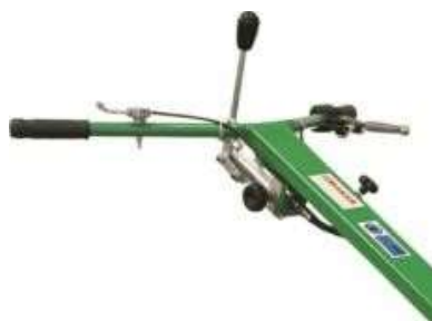
Kit pompa idraulica Hydraulic pump kit