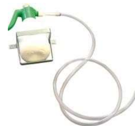
Kit impianto acqua Water system kit

*La macchina è venduta completa di pale combinate montate, documentazione tecnica e certificato CE.