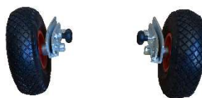
Kit ruote per trasporto Transport wheels kit