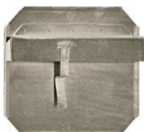
Pala di sgrossatura Floating blade