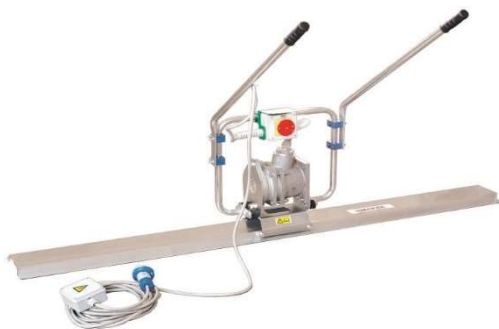
Versione con motore elettrico Electric engine version

Aste in alluminio con profilo curvo o rettangolare disponibili fino a 6 metri di lunghezza Aluminum screeds with curved or rectangular profile available up to a length of 6 meters